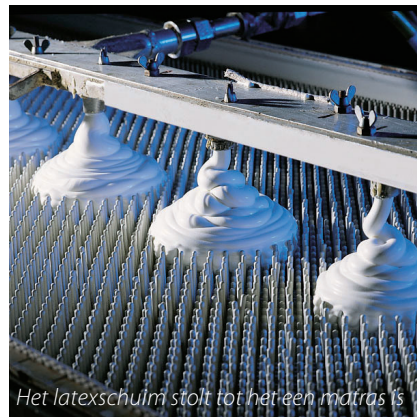
Het latexschuim stolt tot het een matras is

Wil een klant per se een latex matras met spiraalbodem combineren, dan moet hij er op letten dat het matras niet te dun en soepel is. Omdat de persoonlijke ondersteuning geheel uit het matras moet komen, kun je de klant het beste een latexmatras met comfortzones afgestemd op de lichaamsbouw van de klant, adviseren. Een goede optie is een matras van het materiaal talalay. Door het afwijkende productieproces heeft deze latex een betere veerkracht en optimaal ventilerende eigenschappen.